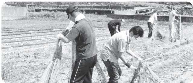
農作業にも挑戦中！

昨年から施設外作業も積極的に取り入れることで、利用者の方がやりがいを持って作業に取り組めるよう支援しています。また、外出や地域イベントへの参加など、楽しい時間を作ることで利用者の方が「また仕事を頑張ろう」と思える活動も取り入れています。