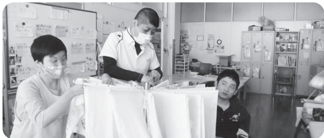
生活訓練の洗濯干し

障がいがあることで日常生活や創作・生産活動において、常時介護が必要な方が利用されており、利用者個々に必要な支援を提供しています。障がいの特性は人それぞれで、必要な支援も違うため、利用者の特性を理解し、できることや得意なことを見つけて、一人ひとりがその力を発揮しながらいきいきと参加できるような活動を提供しています。