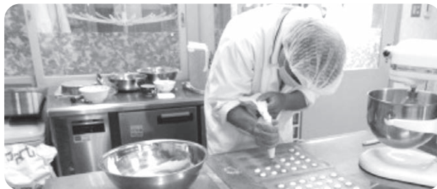
心を込めた手作りクッキー♡