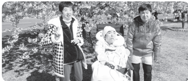
みんな大好き、季節の外出！