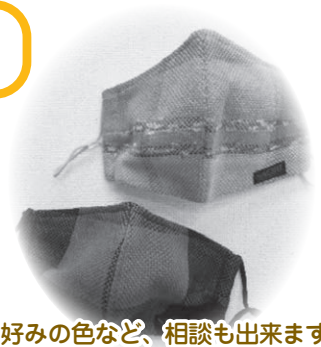
好みの色など、相談も出来ます