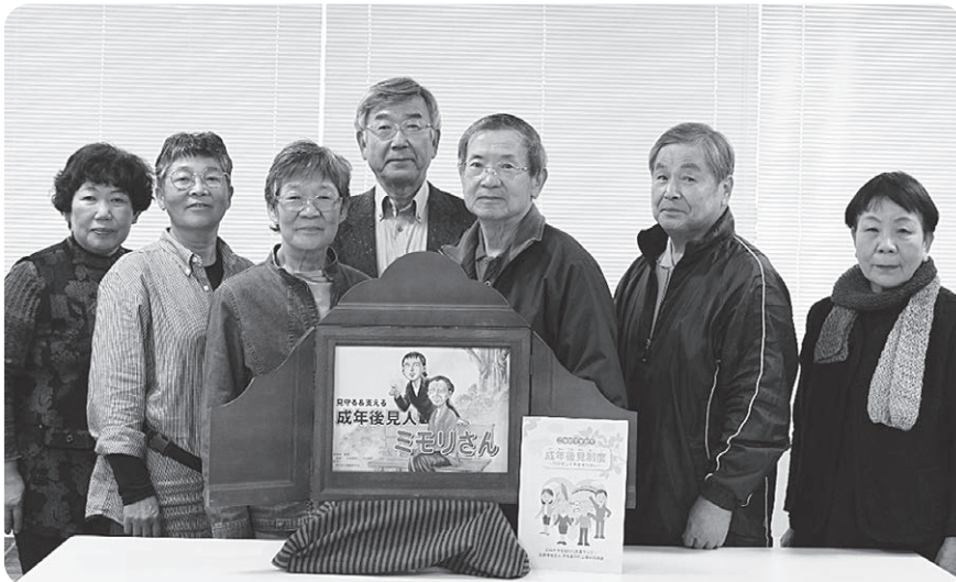
平成 29 年度市民後見人養成研修修了者が役割分担し、音読しました。