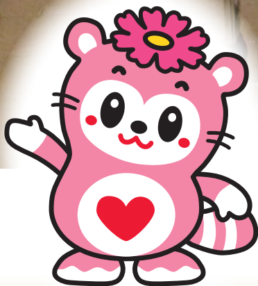
さぬき市社会福祉協議会 イメージキャラクター ふっきーちゃん