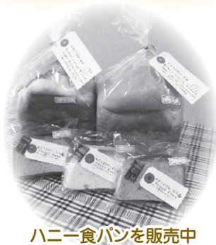
ハニー食パンを販売中

さぬき市障害者支援施設の主たる事業所。最近は施設外作業にも積極的に取り組んでおり、利用者のペースを大切にしながら、いろいろな活動を経験することで利用者の社会的自立を目指します。