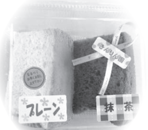
ふわふわのシフォンケーキ

地域の方に支えていただきながら「明るくのびのび、助け合い分かち合う、喜び感謝する」をスローガンに、一人ひとりの個性を大切にしつつ、仲間と協力しながら仕事に取り組んでいます。