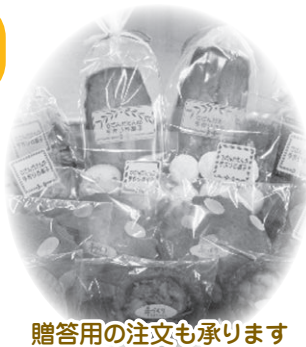
贈答用の注文も承ります

クッキーの販売を始めて十数年、今では「さざんか園といえばクッキー」と知名度もあがり、多くの注文をいただいています。地域での販売や交流を実施することで障害者の理解促進を目指しています。