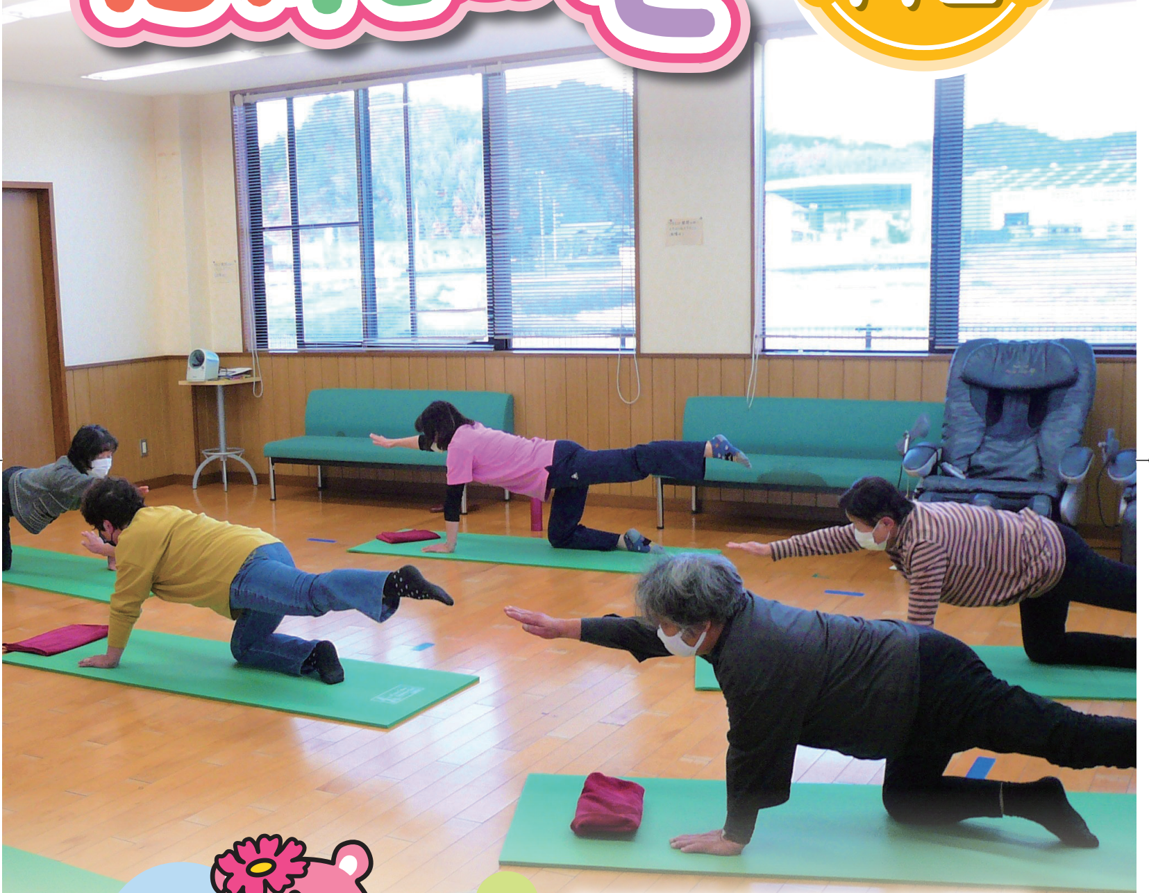
“シニア”のためのストレッチ&筋力アップ教室(3P掲載)