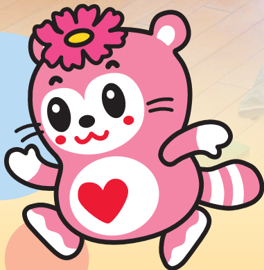
さぬき市社会福祉協議会 イメージキャラクター