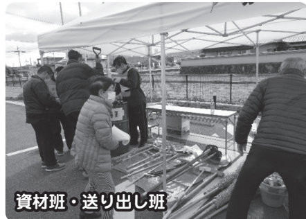
資材班・送り出し班