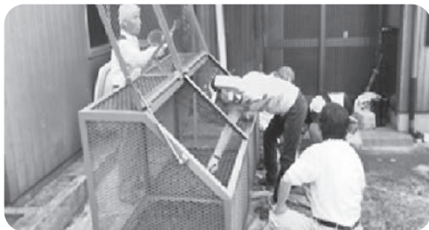
ゴミ集積施設の塗装