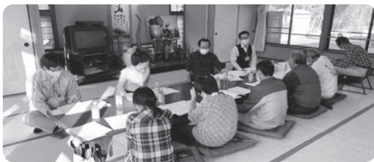
やまびこの風 定例会（月1回開催予定）