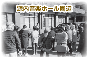
源内音楽ホール周辺

阪神・淡路大震災に因んで制定された「防災ボランティアの日」の1月17日（火）に、全地区一斉クリーン作戦を開催しました。各地区ボランティアネットワーク会員を中心に総勢136名が参加してくれ、避難所等の防災を意識した清掃活動となりました。普段から地域を美しくしていること、それは地域の防災にもつながります。改めて、さぬき市は地域の人に支えられていることを感じました。また、津田の松原では、大川広域消防職員協議会のみなさんがボランティアで参加してくれ、地域の防災に貢献してくれました。