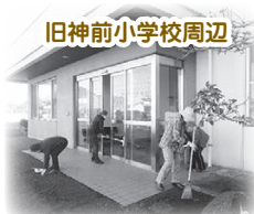
旧神前小学校周辺